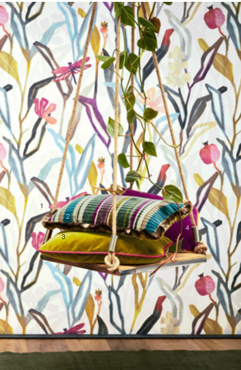
1 Wonderland Wall 416 | 2 Infinity Stripe 645 3 Infinity Plus 174 | 4 Infinity Plus 447