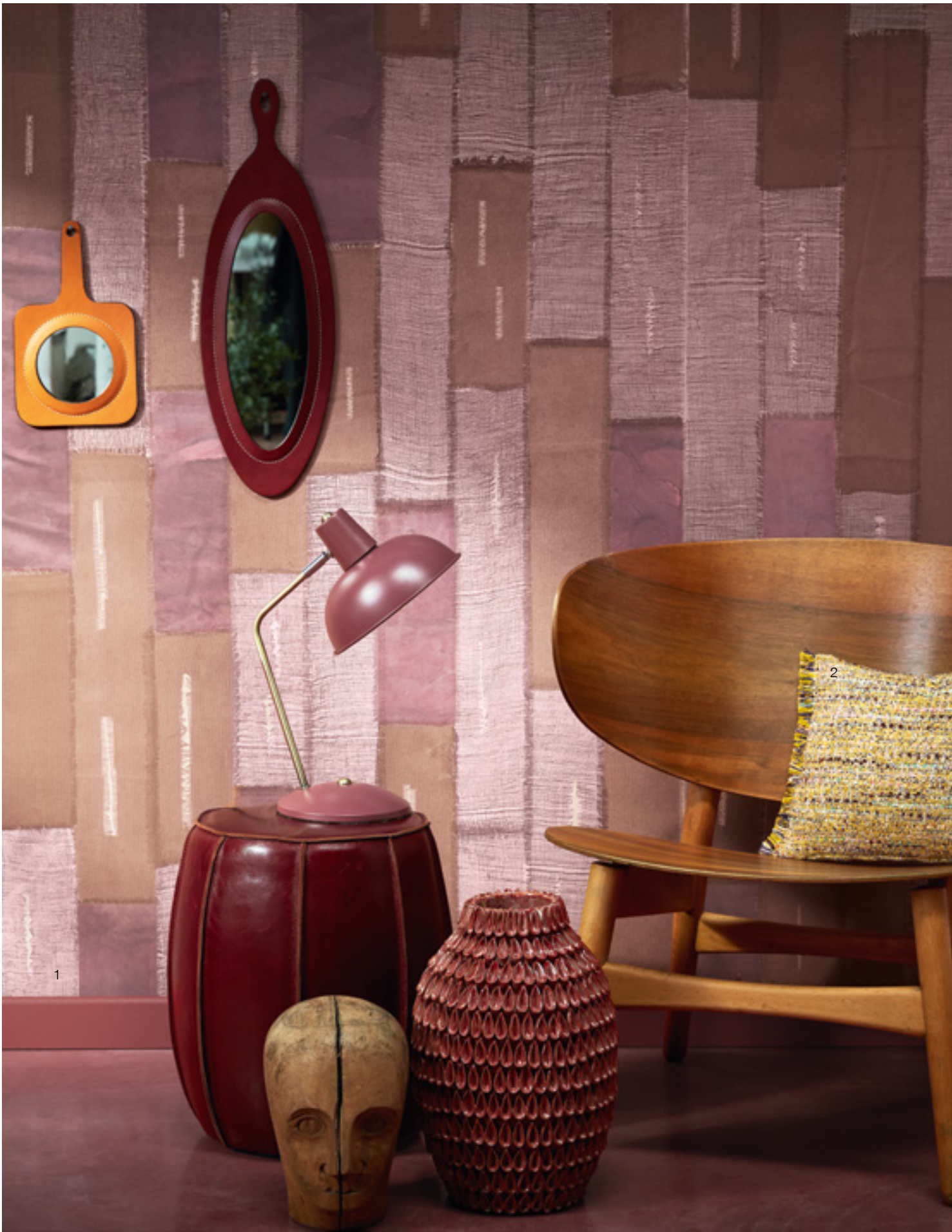
1 Pieces 446 | 2 Salone 155