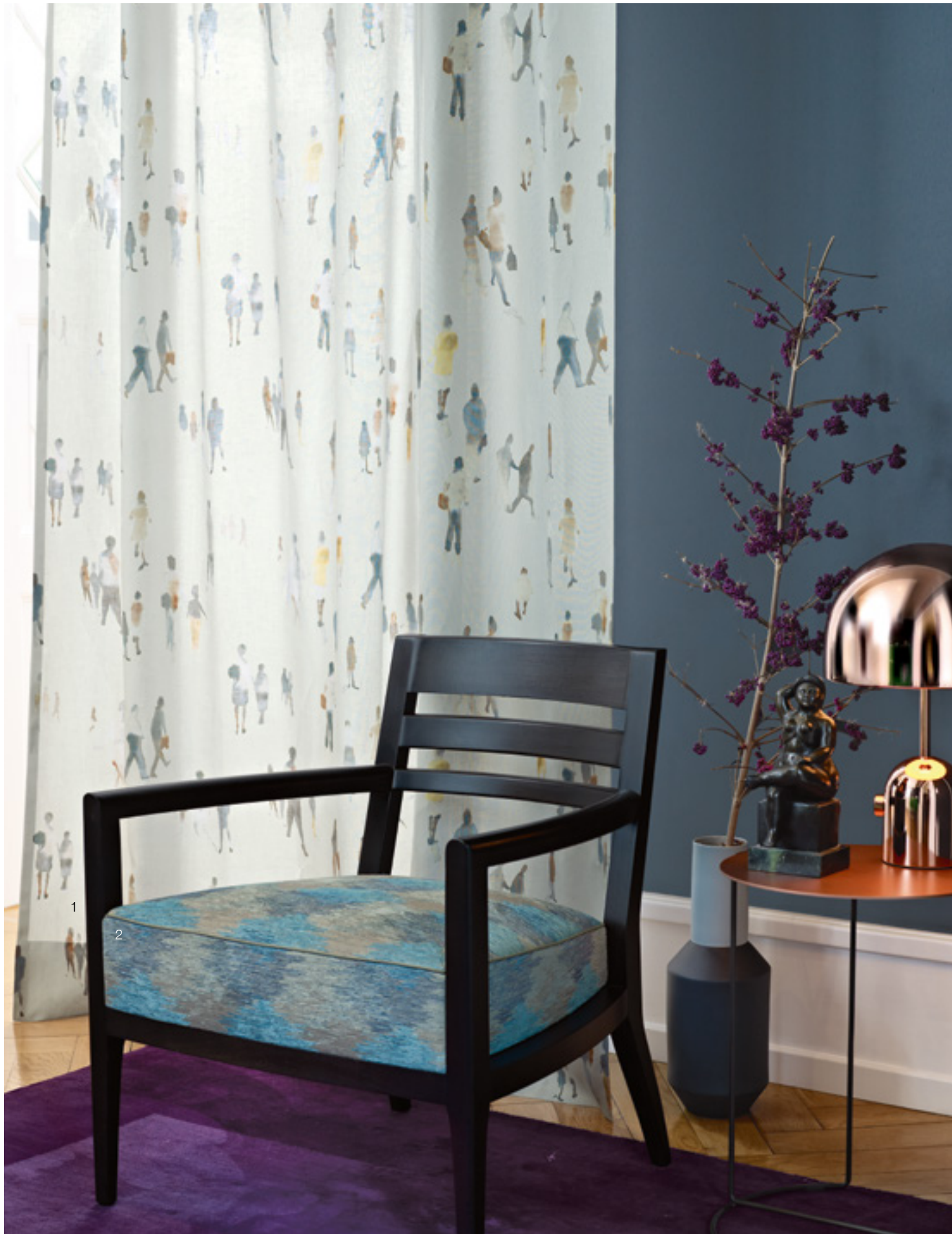
1 Ballade 912 | 2 Vence 596