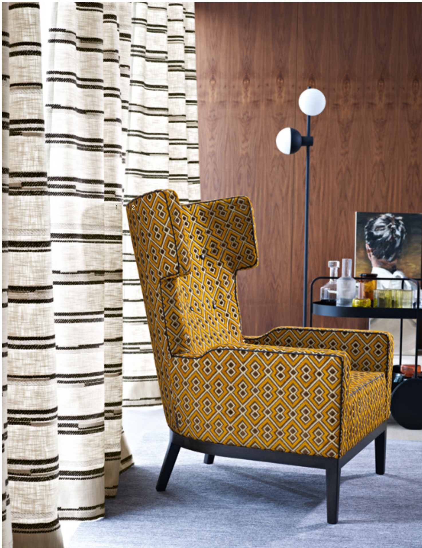
1 Kasba 993 | 2 Yasar 185