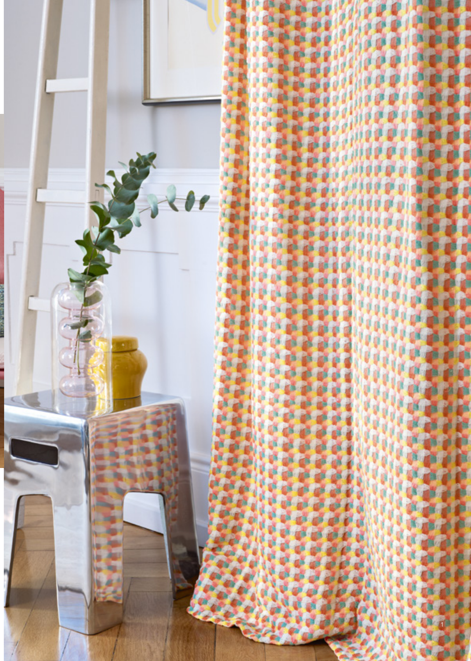
1 Plage 614 | 2 Luna 174, 655 | 3 Tozer 576 Right Page: 1 Petite Terrasse 343