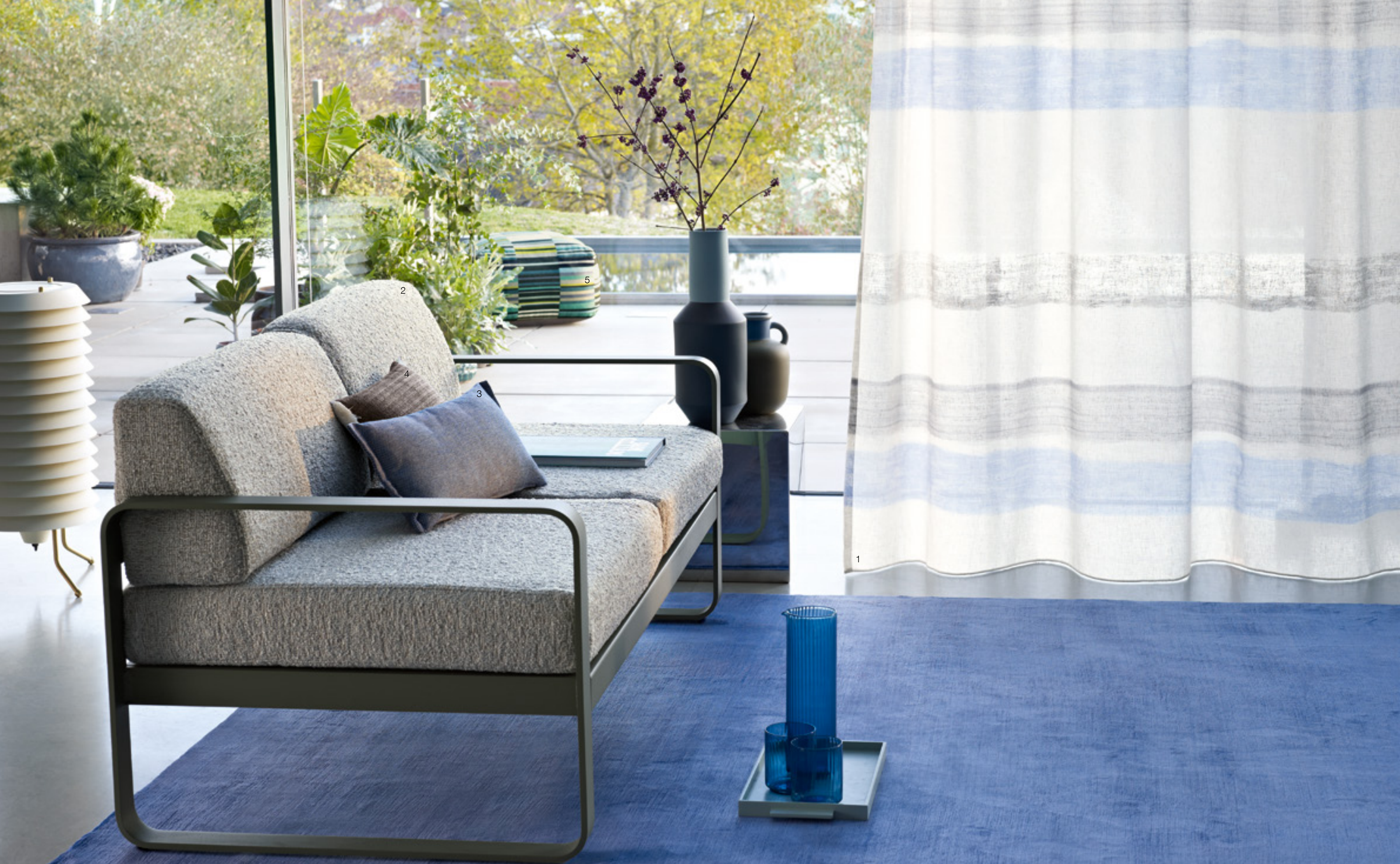
1 Suncoast 592 | 2 Gobi 994 | 3 Tonga 596 | 4 Libeccio 986 | 5 Curacao 656