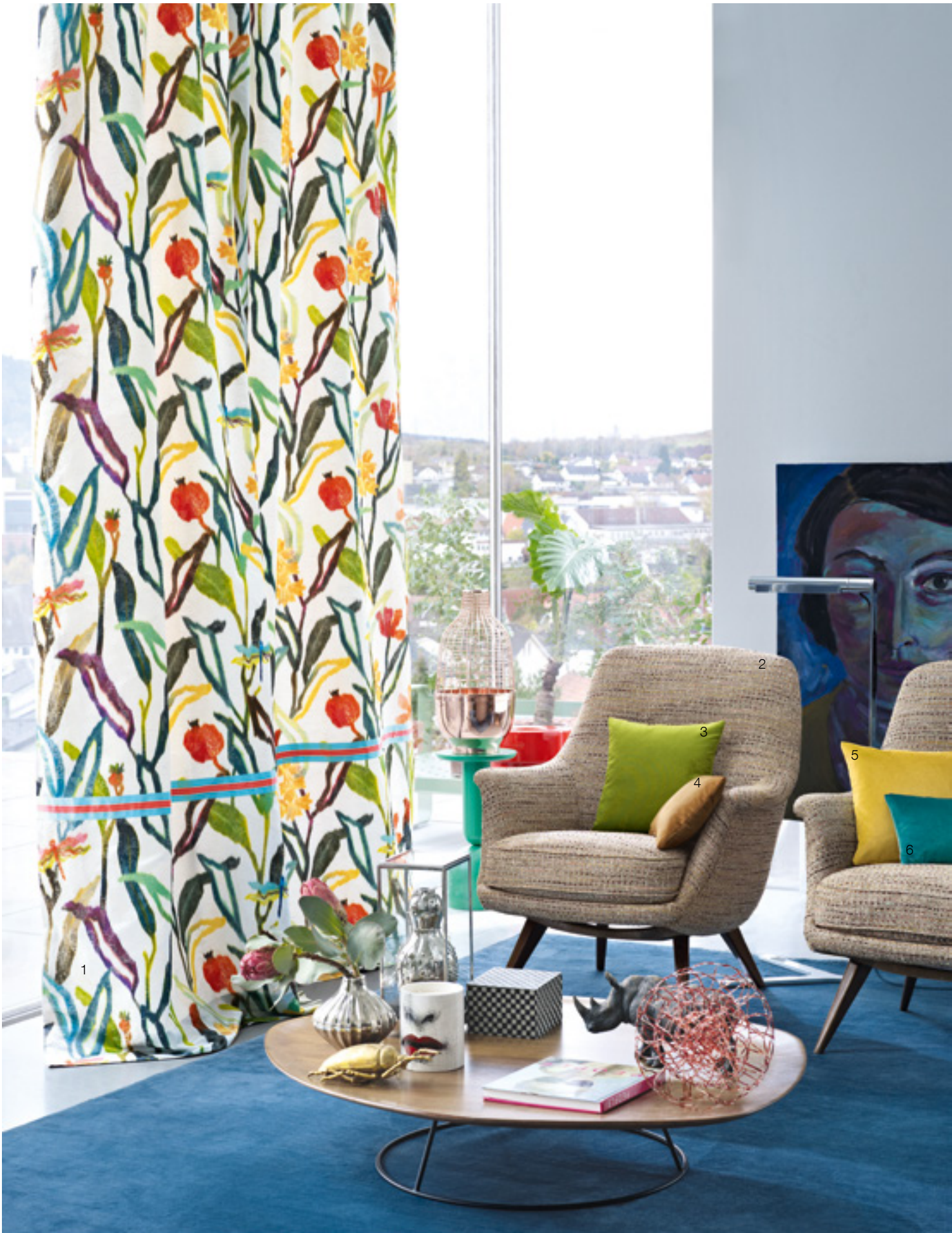
1 Wonderland 676 | 2 Salone 814 | 3 Passion 775 | 4 Passion 185 | 5 Passion 114 | 6 Passion 665