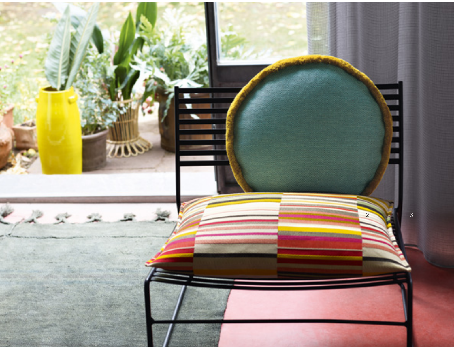
1 Tonga 696 | 2 Curacao 144 | 3 Sorbet 998 Right Page: 1 Curacao 656 | 2 Gobi 991 | 3 Savannah 593 | 4 Libeccio 556 | 5 Tonga 693