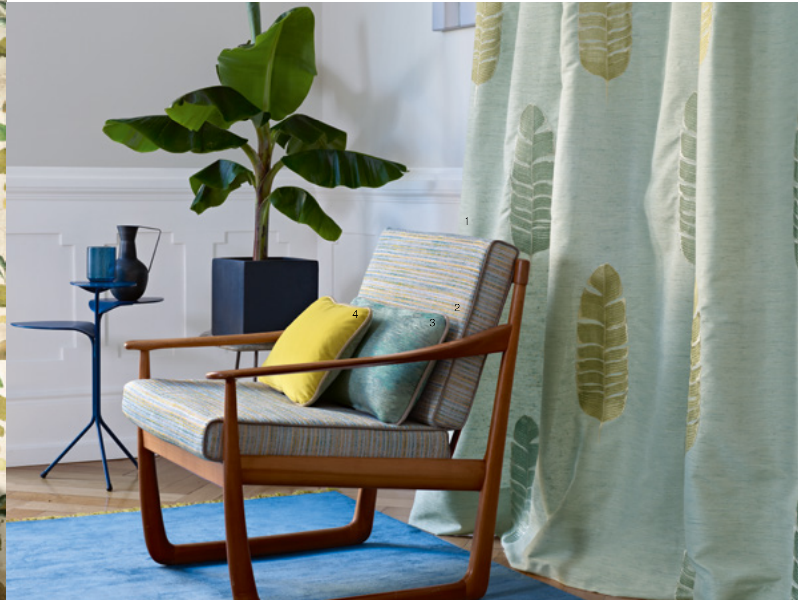
1 Feuille de Bananier 674 | 2 Kelim 612 | 3 Vence 655 | 4 Saga 173 Left Page: 1 Voyage à Tunis 785 | 2 Saga 744 | 3 Tozer 765 | 4 Tozer 194 | 5 Oasis 772 6 Infinity Plus 115 | 7 Saga 757 | 8 Vence 193