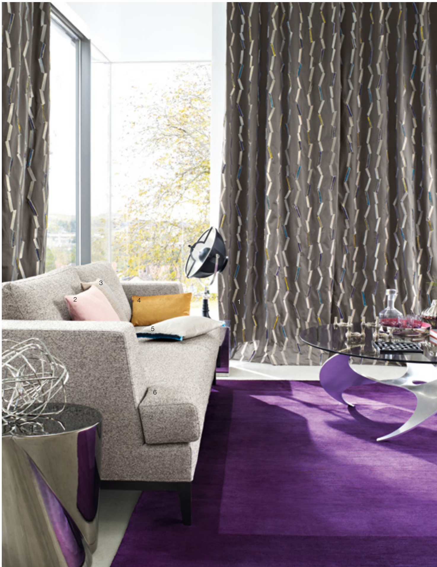
1 Hidden Treasure 918 | 2 Focus 482 | 3 Sinter 983 | 4 Passion 185 | 5 Colibri 901 | 6 Talent 995