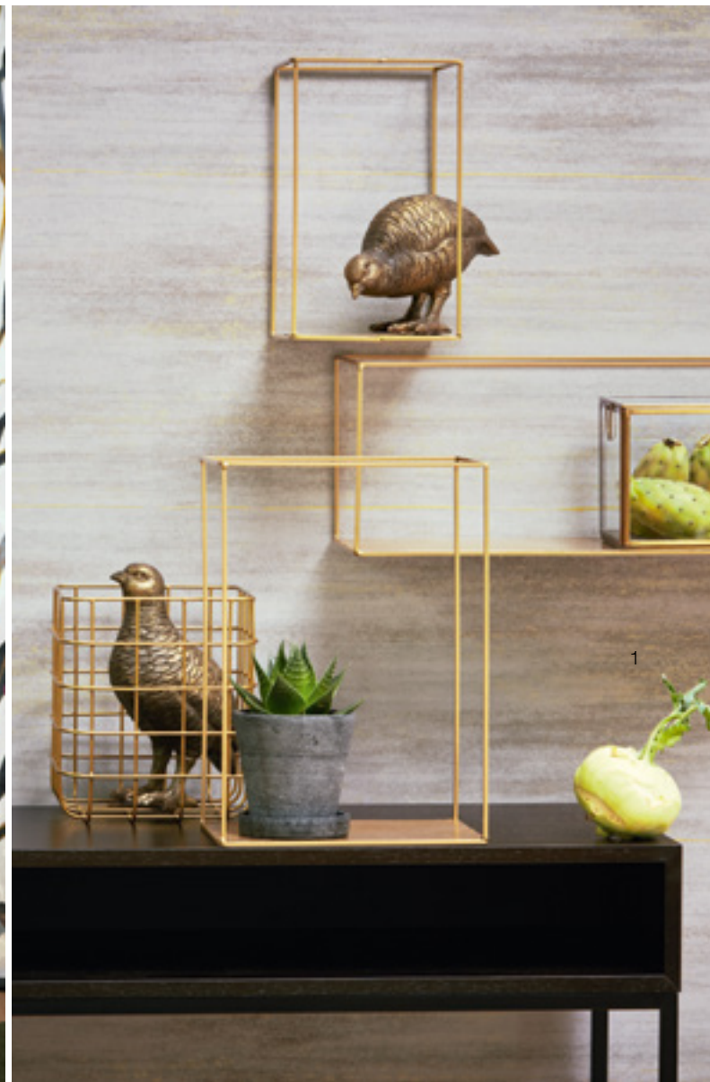
1 Boreal 484 Right Page: 1 Coral Wall 646 | 2 Infinity Plus 496