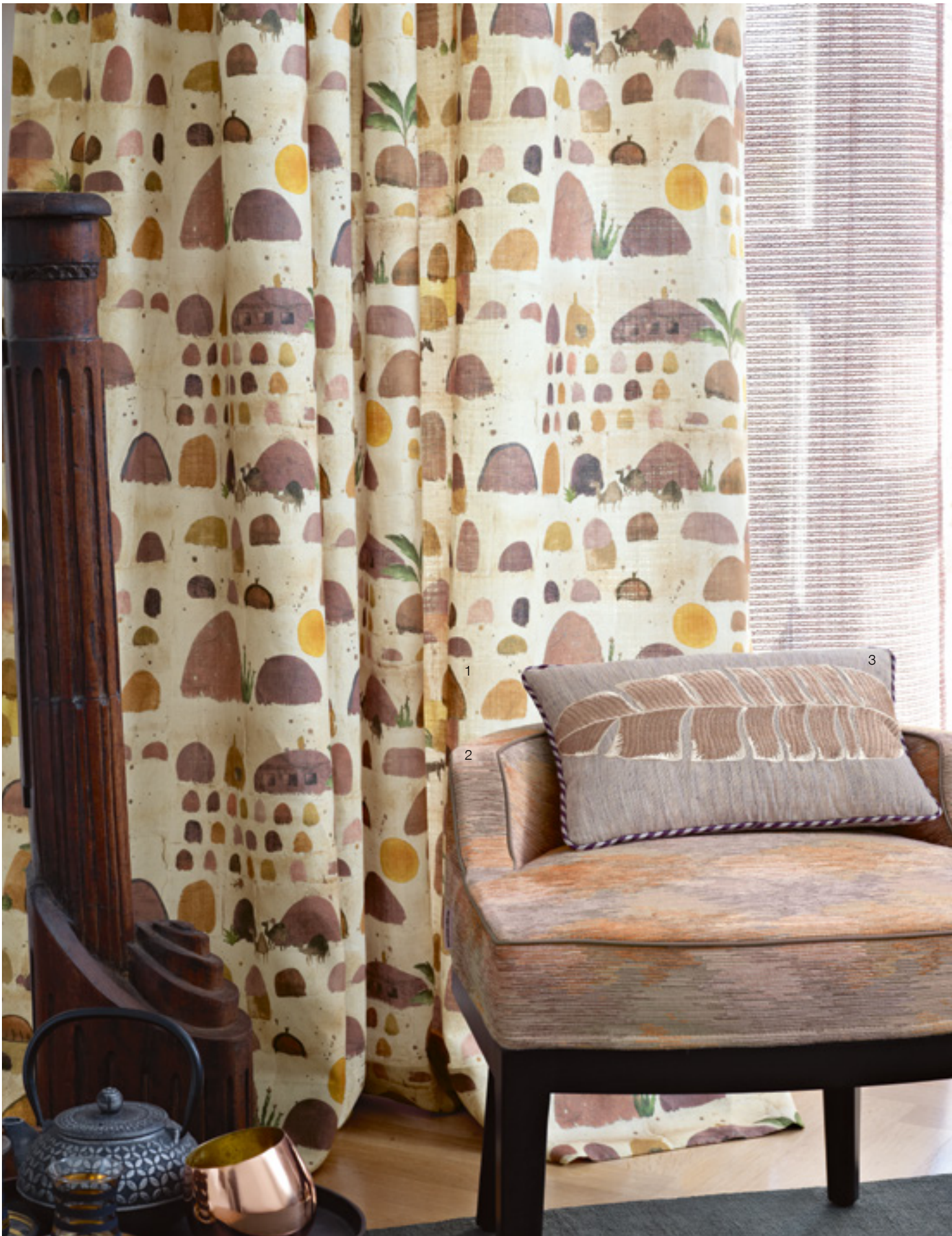
1 Voyage à Tunis 425 | 2 Vence 434 | 3 Feuille de Bananier 495