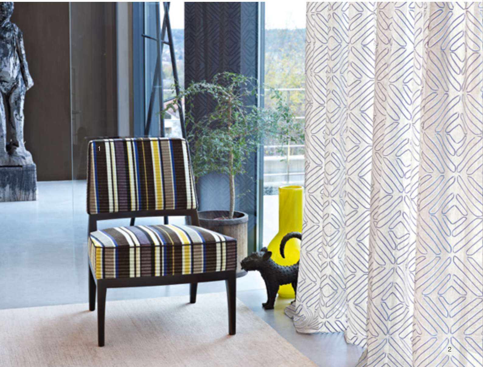
1 Infinity Stripe 415 | 2 Meandro 486